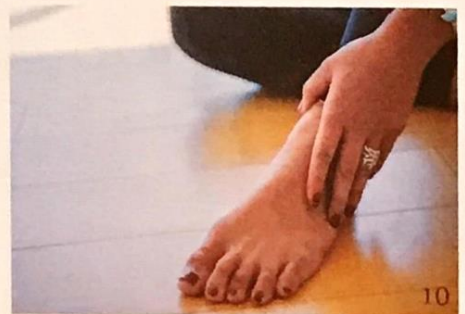
10.「一度は歩くことをあきらめました」。愛おしそうに自分の足をさするTAMAOさん。