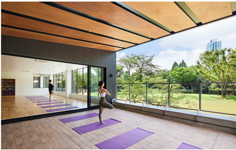
Community Park OTSUKYO (コミュニティパーク大津京) : 大津 滋賀県大津市二本松1-1「ランチ大津京」内 https://communitypark.info/otsukyo/