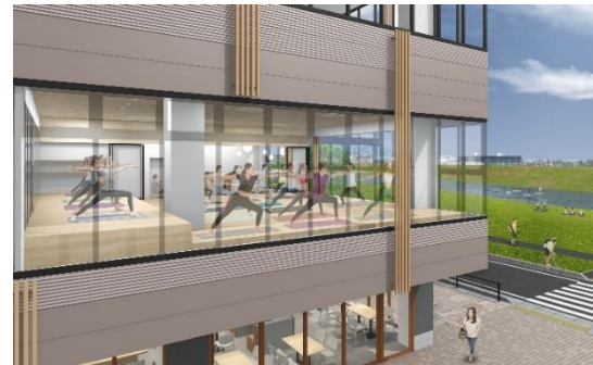
《施設イメージパース》