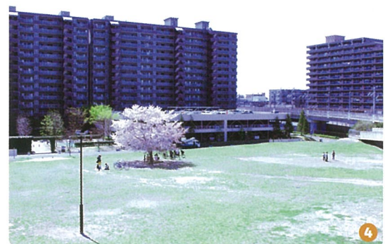
4. 徒歩2分に位置する妙典公園などを利用したプログラムも用意