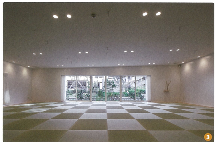
3. ヨガスタジオの床には半畳の琉球畳を使用