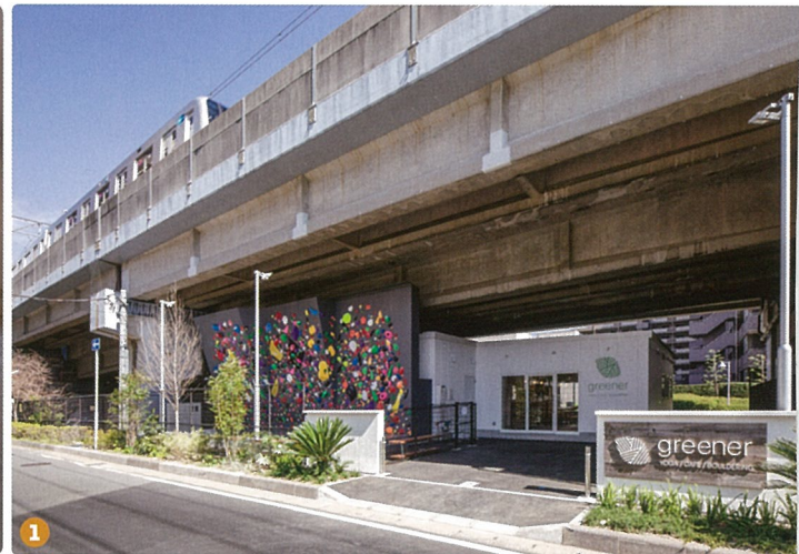
1. 高架の線路を挟んで両側からアクセスできる(Photo by Tatsuya Noaki) 2. カフェラウンジ(カウンター6席、テーブル8席+立席) (Photo by Tatsuya Noaki)